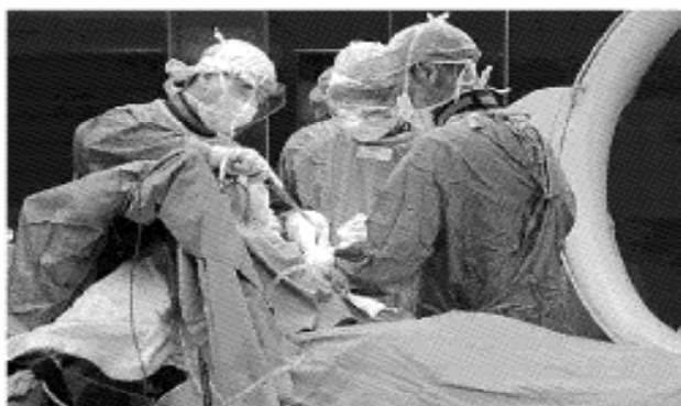
Usl 16 e Azienda Ospedaliera hanno perso una causa contro 259 dipendenti

nissero rispettate le regole. Abbiamo ottenuto una vittoria piena, tanto che gli enti sono stati condannati non solo a rimborsare i dipendenti, ma anche a sostenere i scimila euro di spese legali». Tognazzo e Zuin, a fronte del cambio ai vertici delle due aziende sanitarie, sperano di chiudere le vertenze legali, riportando la trattativa sindacale nella sua sede naturale, che di certo non è il tribunale. A 259 dipendenti dovranno essere restituiti 100 euro a testa in busta paga. A fronte di un silenzio sui pagamenti, l'avvocato è già pronto a partire con la procedura di pignoramento. (f.a.p.)